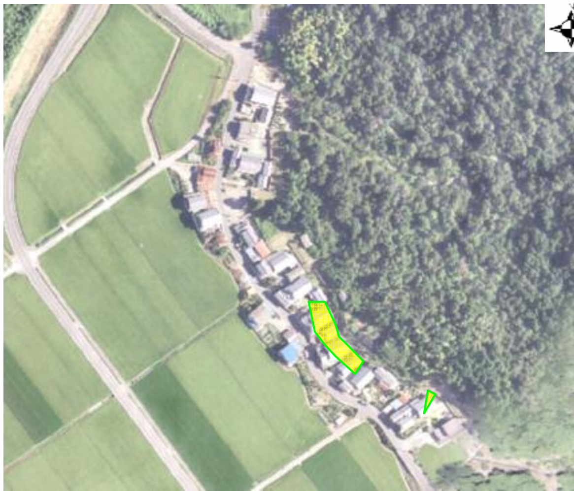
土砂災害警戒区域・土砂災害特別警戒区域 写真図