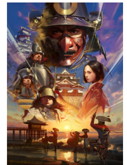
メインビジュアル

「戦国ワンダーランド滋賀・びわ湖」は、滋賀県内に数多く残された戦国の史跡などを、広く全国に向け発信する観光キャンペーンです。