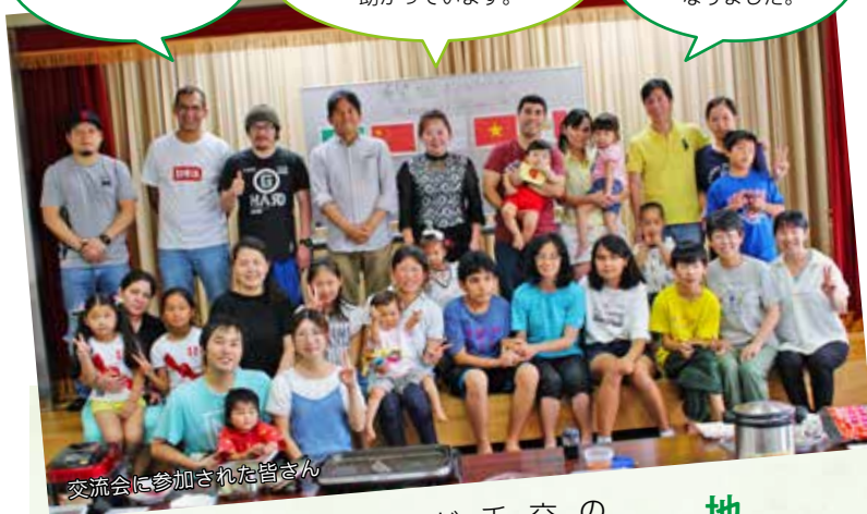
交流会に参加された皆さん

同じ地域にいる方がわかって、安心します。 日本人も外国人も関係なく、子育てなどの情報交換ができて助かっています。 交流会で知り合い、日頃も声をかけやすくなりました。