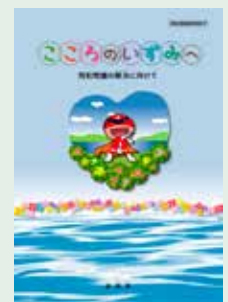
同和問題啓発冊子 「このころのいずみへ」