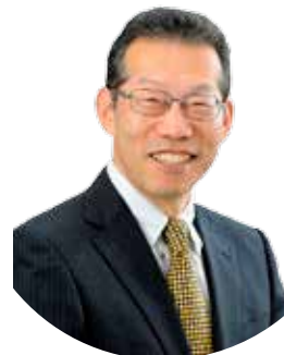
(株)情報文化総合研究所 代表取締役、武蔵野大学 名誉教授