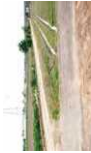
出庭工区築進立杭付近