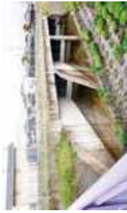
新守山川吐出口 (守山市三宅町)