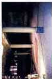
貯留兼沈殿施設内部

市街地排水を貯めて、砂や石などの大きなものを沈殿分離します。上流の水は接着剤化沈殿などで浄化し、更に処理した流れは琵琶湖下水道事業に入れた浄化センターで処理します。