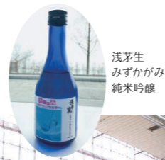
浅茅生 みずかがみ 純米吟醸