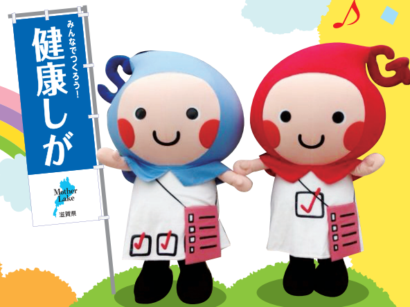
滋賀県健康づくりキャラクター 「しがのハグ&クミ」