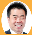
滋賀県知事 三日月大造

12:00~ 「健康しが」キックオフ スペシャルトーク 未成由美・麻倉ケイト・知事トークショー