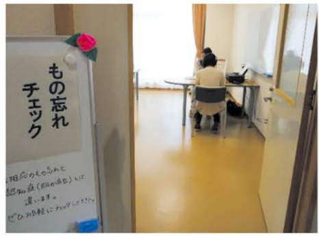
↑“認知症タッチパネル”