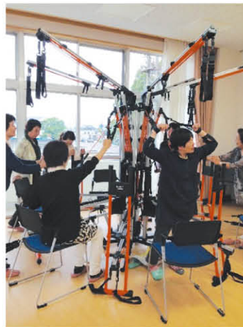
↑“ボディスパイダー”でストレッチ↑