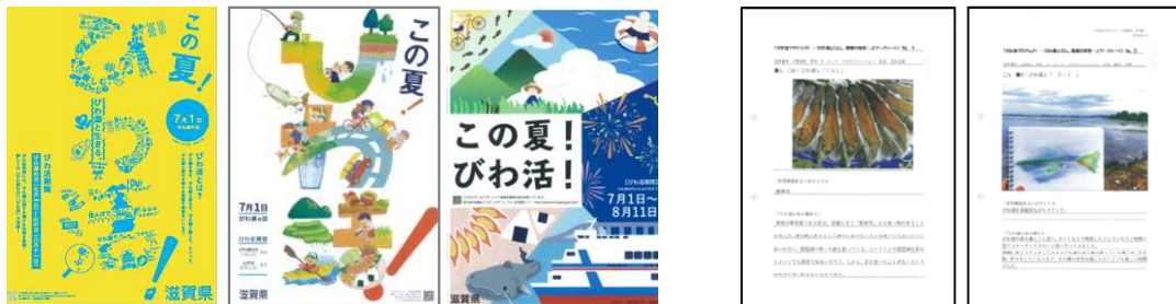
（ポスターデザインの一例）