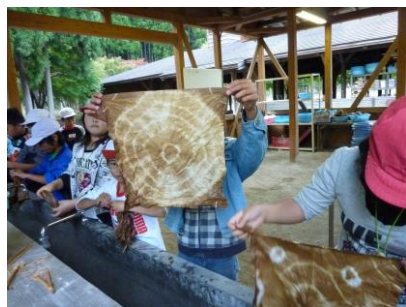
クラフト作品「未来の森」