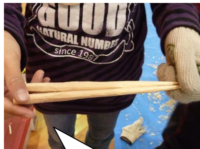
〔間伐材を利用したお箸〕