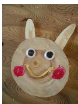
〔間伐材を利用したクラフト〕