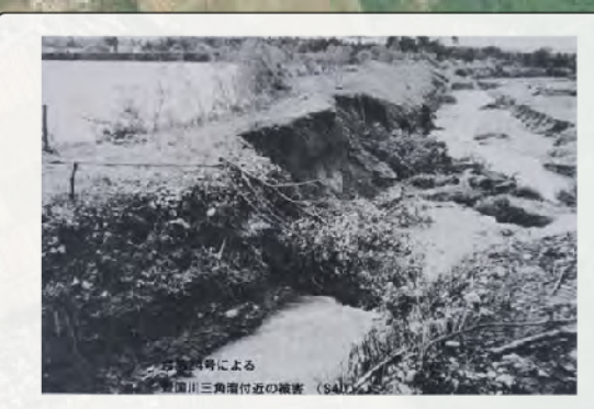
S40 台風による豊国川三角溜の被害…⑭