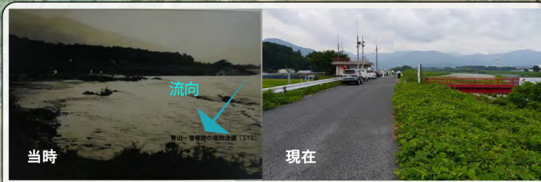
S13 台風での決壊時と現在の写真…①