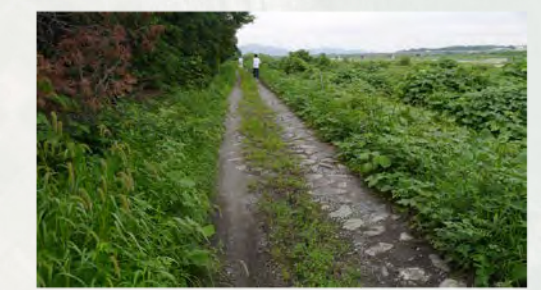
S28 堤防決壊の補修跡…⑨ 決壊箇所には堤防上に石が敷いてある。