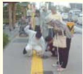
点字ブロック敷設状況調査