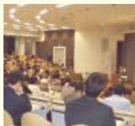
研修会に参加する事業者