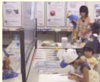
ユニバーサルデザイン製品の体験展示