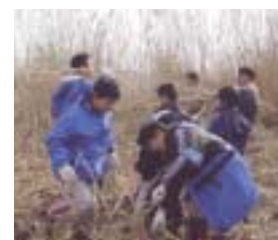
菜の花を資源循環の地域づくりに活用