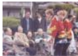
外国人と共生し、また多くの外国人が訪れる滋賀県

滋賀県内の、韓国・朝鮮、中南米、中国などの出身の在住外国人は2万5千人を超えています 滋賀県を訪れる外国人観光客は、年間およそ8万人にのぼります