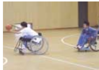
交流車いすバスケット

障害のあるなし、年齢、性別などにかかわらず、すべての人があるがままの姿で同等に社会生活をおくり、自立し、社会活動に参加できることが必要です