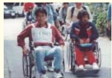
団体によるまちあるき調査