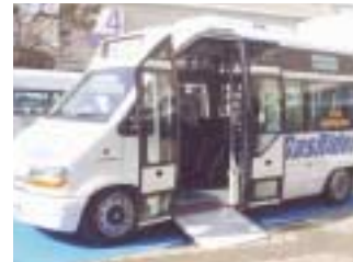
だれもが乗降しやすい段差のない低床バス