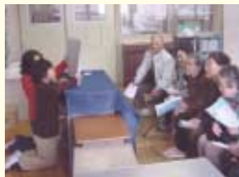
小学校での福祉教育