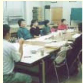
地域の施設について話し合い