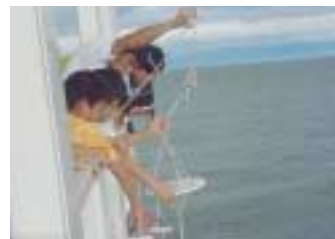
学習船「うみのこ」で水質チェックする子どもたち

日常生活や事業活動のあらゆる場面で環境負荷の原因になっており、すべての人が、その原因をつくっている者であるとともに、その影響を受ける者にもなっています