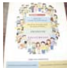
駅利用者のための2か国語表示 多言語による非常時対応パンフレット

一人ひとりが、かけがえのない人間として、互いに尊重し、思いやる社会を築いていく必要があります