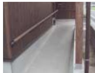
文字が大きく、色分けが見やすいリモコン 玄関までスロープにし、手すりを設置した住宅

同じ地域社会の一員として、在住外国人が困っていることに対する配慮が必要です 国際的な視野で社会環境作りを進めていく必要があります