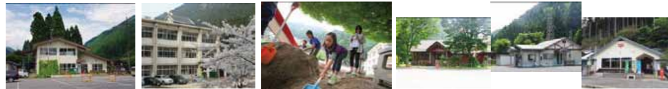
市民センター 葛川小中学校 児童クラブ 診療所・駐在所・郵便局