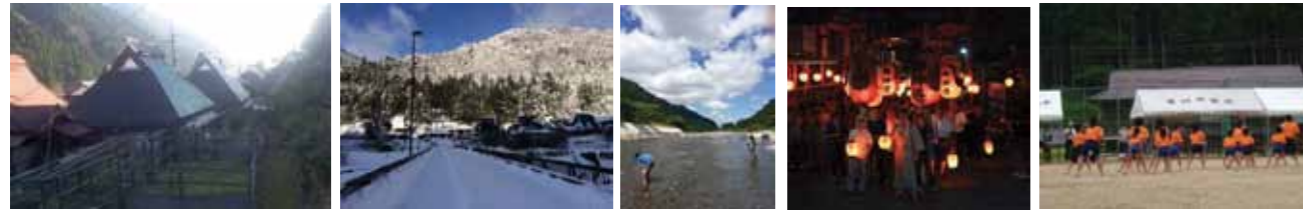
伝統的な入母屋集落群 清々しい雪の朝 夏の川遊び 葛川祭り 地域挙げての運動会

村づくり協議会では、大津市葛川地域への移住に興味をお持ちの方々に必要な情報の提供と、暮らしのサポートを行っています。四季折々の変化に富んだ自然の中で、都会では味わえない生き生きとした生活が待っています。多少の不便さも魅力のうちですが、小中学校・役場・診療所・郵便局など安心して生活できるツールは整っています。また移住体験や家族留学、住居探しのお手伝いなど、協議会役員や先輩移住者も様々な相談に乗ってくれます。