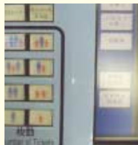
英語や絵文字表記のある券売機