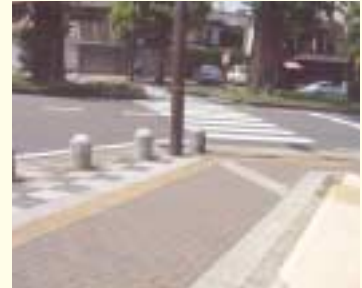
点字ブロックと色分けした段差のない歩道