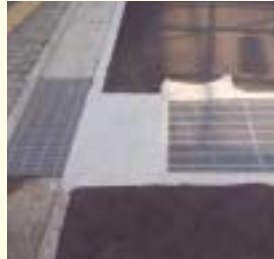
車輪等が挟まらない すき間の狭い溝ふた