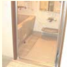
段差がなく、手すりの付いた浴室