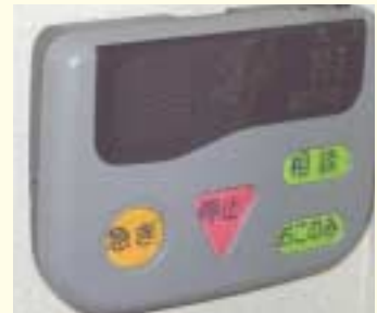
ボタンと字が大きく、色分けされたスイッチ