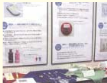
パネルや現物の展示、体験による情報提供