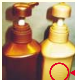
容器に刻みがあって リンスと区別できるシャンプー