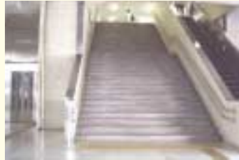
エレベーター、階段、エスカレーターが併設設置された駅