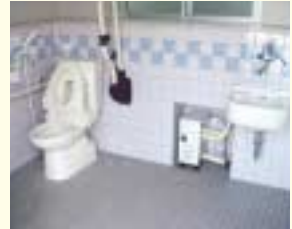
シャワーつきオストメイト対応トイレ