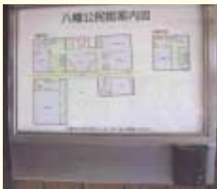
点字表示、インターホン、人が通ると感知するセンサー付き案内図