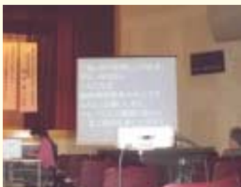
要約筆記 (話の内容を要約してスクリーンに投影)