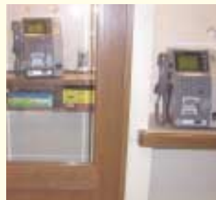
高さの違う電話台設置