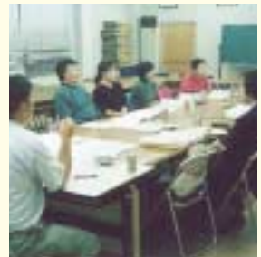
地域の施設について話し合い