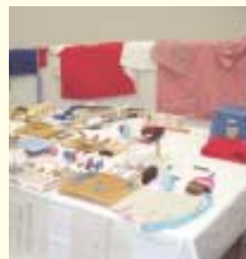
改良した福祉用具などの展示