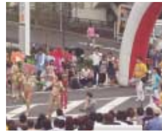
外国人と共生し、また多くの外国人が訪れる滋賀県