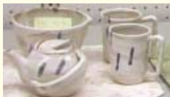
県特産物のユニバーサルデザイン商品の開発研究