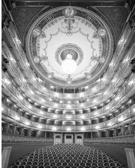
ヨーロッパの中でも、最も美しく歴史的な劇場建築のひとつに数えられ、モーツァルトと縁が深いことから「モーツァルト劇場」とも呼ばれています。映画「アマデウス」のオペラシーンはこの劇場で撮影されました

この成功を受けて劇場はモーツァルトに新たなオペラの作曲を依頼、あの名作《ドン・ジョヴァンニ》が生まれました。プラハ国立劇場「スタヴォフスケ劇場」は、モーツァルトの指揮でこのオペラを初演した劇場としても有名です。今回上演される《フィガロの結婚》は、この歴史ある劇場が今年2月に新作制作したばかりの作品で、シンブルな中にも伝統と新しさを両立させた魅力あふれる公演です。モーツァルトと所縁が深く、モーツァルトに愛され、モ