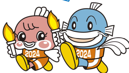
大会マスコットキャラクター 「チャッピー」 「キャッピー」

より多くの皆さまから親しまれ、愛されるキャラクターとなるよう、ご支援・ご協力をお願いします！