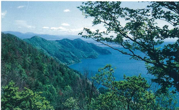
湖北の山なみと琵琶湖