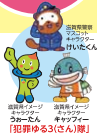
滋賀県イメージキャラクター うおーたん キャットファイ 滋賀県イメージキャラクター マスコットキャラクター けいたくん [犯罪ゆる3(さん)隊]