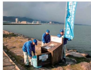
写真2-11-1 外来魚回収ボックス

釣りというレジャーの側面からも外来魚を減らし、琵琶湖の豊かな生態系を保全するため、外来魚のリリースを禁止しています。釣り上げた外来魚は回収ボックスや回収いけすに入れてください。