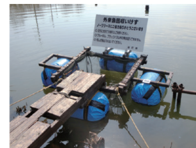
写真2-11-2 外来魚回収いけす