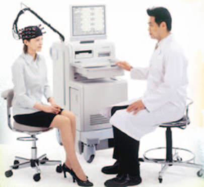
▲日立製作所資料より抜粋

光トポグラフィー検査は、平成26年度に機能的な精神疾患の臨床検査として初めて保険適用された検査です。当センターでは滋賀県初の 保険適用病院 として6月から1泊2日の「 光トポグラフィー検査入院プログラム 」を開始します。