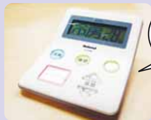
冷房28度設定で運転中です。