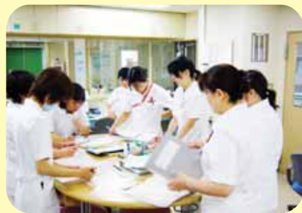
病棟ミーティングの様子

この病棟には、何らかの病気で障害や後遺症があり生活をおくる上で不都合となるところをもつ方が入院して来られます。そういった方に対し、不都合をできるだけ少なくしてその人の持つ力を最大限に引き出し、その人らしく生活する方法が身につけられるように援助をしています。患者さんのそばに24時間いる看護師や介護福祉士だから気付くことがあり、できない事を助けながら、今ある力を活かせるように手を出さず、目を配る。訓練で身につけた事が日常化するために個別の方法で行うことを看護計画で統一し繰り返し関わっています。生活者の視点を持ち、可能な限り退院後の生活に近い生活リズムを作り、その人・その家族が安心して退院後の生活に臨めるように、自立のための看護指導、ご家族への介護指導を行っています。