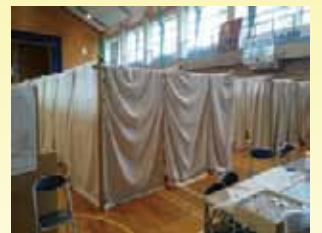
【第4班(H28.4.29～5.4) 派遣 乙川 亮 (作業療法士)】

今回は阿蘇大橋の崩落など被害の大きかった立野地区以外の長陽・白水・久木野地区で避難所巡回や自宅への訪問を行いました。