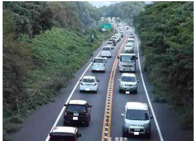
2車線部における通勤時間帯の慢性的な渋滞状況