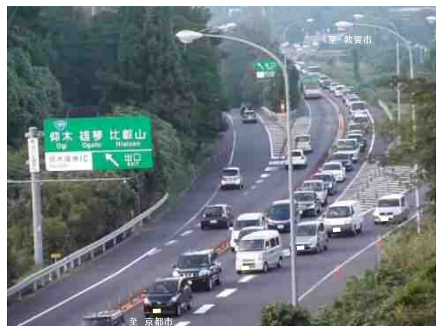
2車線部における合流箇所の渋滞状況