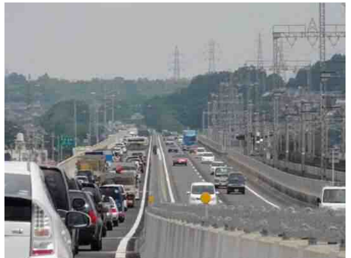
4車線部から2車線部への渋滞状況