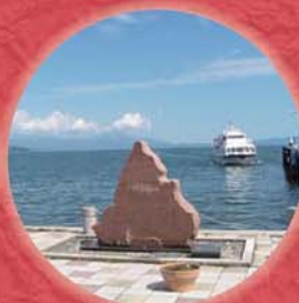
琵琶湖周航の歌 歌碑