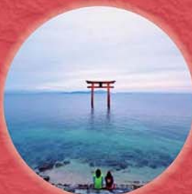
しらひめ 白鬚神社