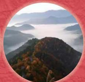
おにゅうだに 小入谷の雲海