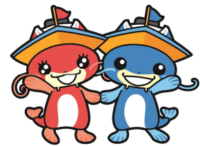
マスコットキャラクター 「ビナスちゃん」「ピナちゃん」

また、びわこボートレース場ではボートレース以外に、ファミリーカーニバルの開催や、スモールドラゴンボート日本選手権大会の会場として施設を開放するなど、施設の紹介やボートレースのPRに努めています。