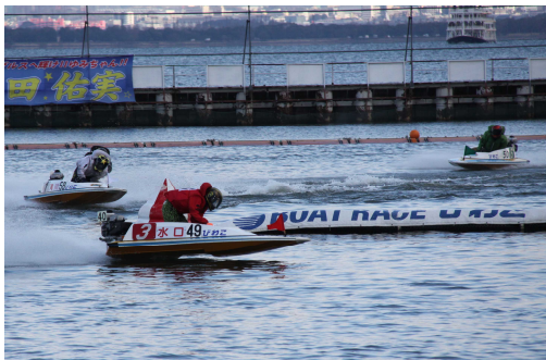
迫力のボートレース