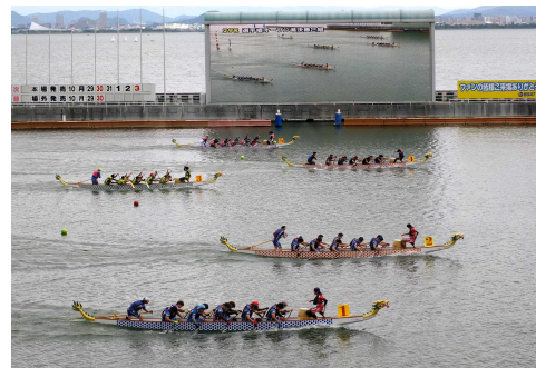
スモールドラゴンボート日本選手権大会 （平成28年10月23日（日））