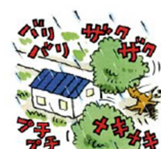
がけの上の木がゆれたり傾いたりする 地鳴りがする