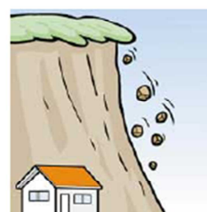
がけから小石がパラパラ落ちてくる①