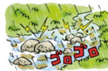
川の中でゴロゴロという 音がしたり 火花が見えたりする