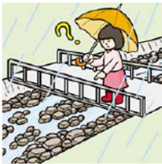
雨は降り続けているのに 川の水が減る①