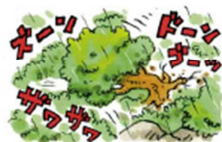
山全体がうなっているよ うな音がしたり 地震のようにふるえたり 異常なおいがする