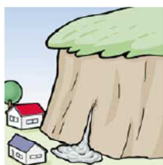
がけから急に水がわき出る①