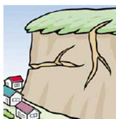
がけにひびわれができる