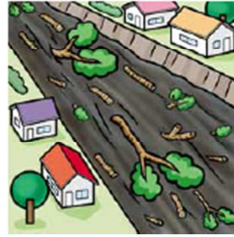
川の水がにごり、水と いっしょに倒れた木が流 れてくる①