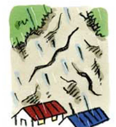
がけにひびわれができる また、がけがふくらむ