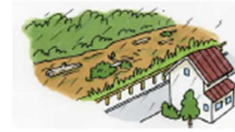
川の水がにごり、水と いっしょに倒れた木が流 れてくる②