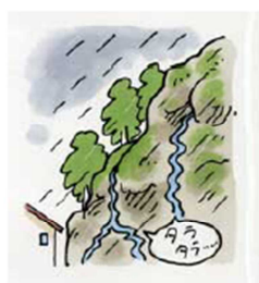
がけから急に水がわき出る②