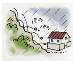
がけから小石がパラパラ落ちてくる②