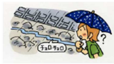
雨は降り続けているのに 川の水が減る②