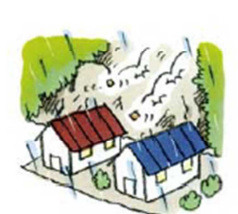
がけから小石がパラパラ落ちてくる③