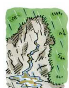
がけから急に水がわき出る わき水の量が急に増えたり ふき出したり急に止まったりする 水がにごる