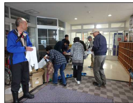
平成28年に続き平成29年も避難訓練を実施