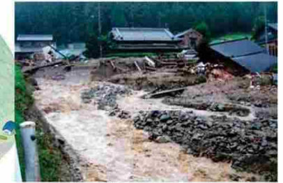
三重県津市美杉町石名原(平成23年9月4日発生)

谷や斜面に貯まった土砂が、雨や川の水とともに一気に流れ出す現象。スピードが速く、破壊力も大きい。