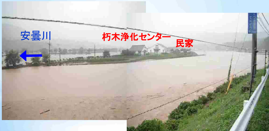
安曇川が増水して農地に流入