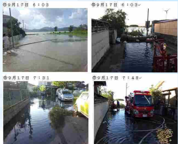
琵琶湖水位の上昇は、大雨が終わって川の水位が引いたあと、時間差で起こる！