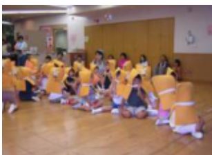
防災頭巾を被って避難