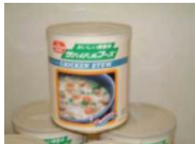
非常食を使った食事作り

学校宿泊体験を通して、地震など自然災害に対する心構えを学ぶ。 クラス、学年の友達と共同生活を行い、協力することや指示を聞いて安全に 落ちついて行動できるようにする。 引渡し訓練を行い、家族で防災について話し合う。