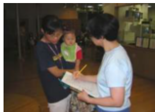
確認事項のチェック