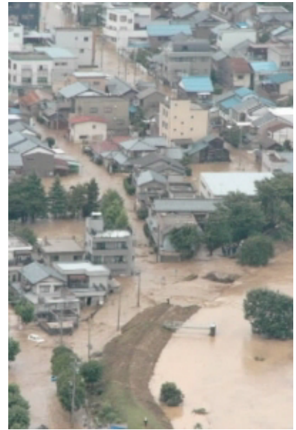
足羽川の決壊で浸水した福井市街地