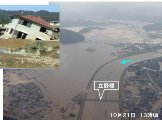
円山川の決壊(兵庫県豊岡市)