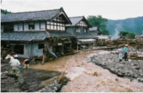
写真上: 氾濫水により損壊した民家 写真右: 濁流で寸断された国道橋 (ともに福井市内)