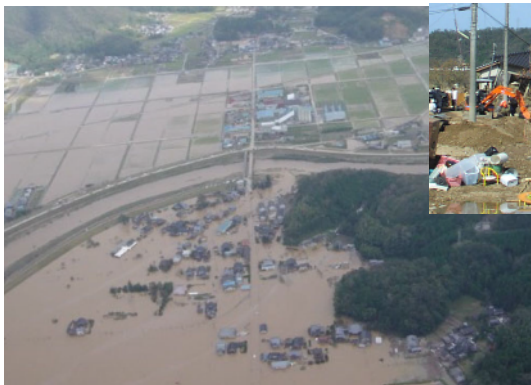
出石川の決壊(兵庫県出石町)