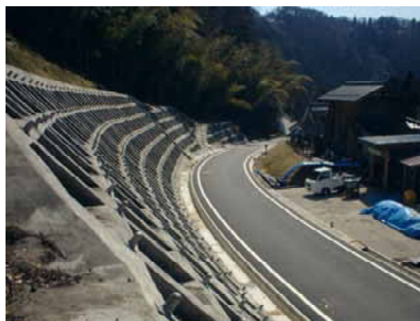
[ 現在の様子 ]