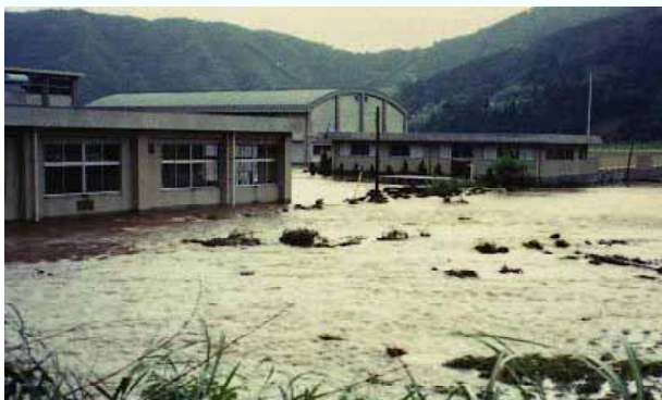
[ 昭和50年の台風6号による水害 ]

西浅井町の おおかわ 大川では、過去にしばしば大雨が降って川の水が氾濫し水害がおこっています。特に昭和50年の台風6号による洪水では、堤防の決壊により西浅井中学校が浸水するなど甚大な被害をもたらしました。こうした水害を未然に防ぐため、川幅を広げたり川底を掘り下げたりする河川改修工事を行っています。