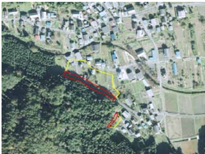
急傾斜危険箇所(余呉町)

これら区域の調査や指定について、今後も引き続き行ってまいりたいので、皆さまのご理解、ご協力をよろしくお願い申し上げます。