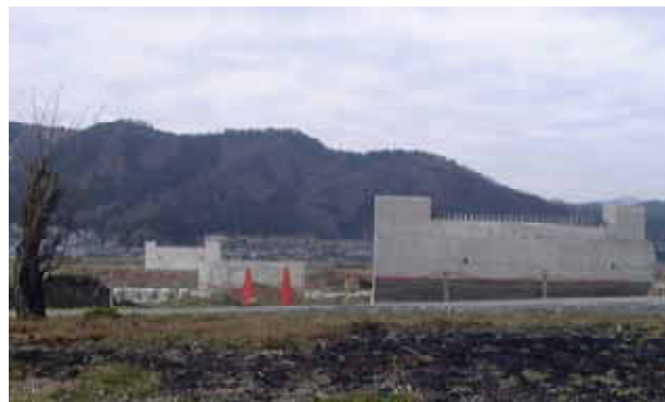
[ H17.3現在の様子(野田橋) ]

現在、大川の最下流にかかる のだばし 野田橋の架替え工事を行っています。平成14年度から工事を始め、橋の土台となる部分が平成16年度末に完成しました。今年度は橋の桁を架ける工事に着手します。来年の今頃には野田橋を通して大川を渡っていただくことが出来ると思います。