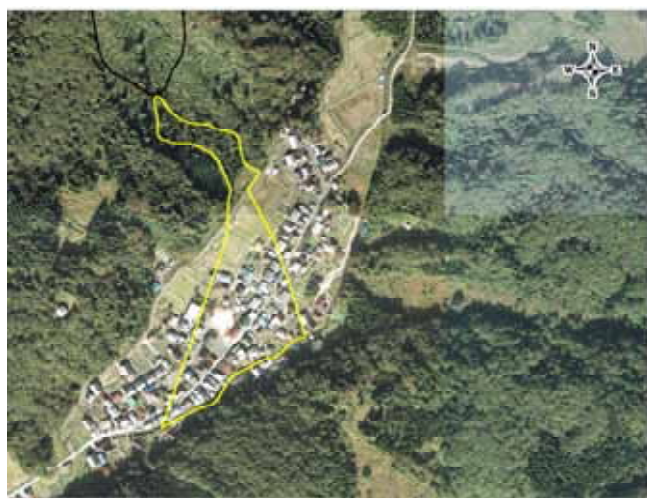
土石流危険箇所(西浅井町)