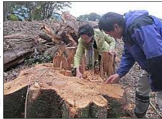
嘉田知事が現地視察