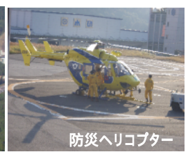
防災ヘリコプター

この写真は10月24日に、滋賀県の防災ヘリコプターで撮影した新名神高速道路の写真です。