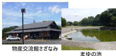
物産交流館さざなみ