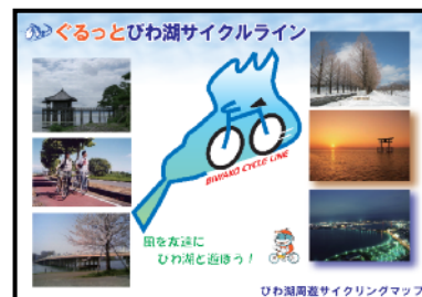
びわ湖周遊サイクリングマップ

滋賀県では琵琶湖を一周するサイクリングコースとして、「ぐるっとびわ湖サイクルライン」を設定しています。瀬田唐橋の中ノ島を起点とし琵琶湖を周遊する全長193kmのコースで、既存の道路を活用して安全かつ快適に利用できる道路を選定したものです。道路課ではこのコース