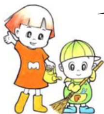
美知普請イメージキャラクター 「みちちゃんとふしんちゃん」

滋賀県では、県と県民やNPO、企業などが協働して道路管理を行う「近江の美知普請」を進めており、その中の一つが「マイロード登録者制度」です。毎日の通勤・通学・買い物などでお使いの道路をご登録いただき、その道路に穴ぼこなどを見つけた場合には県の土木事務所まで知らせていただくボランティア制度です。