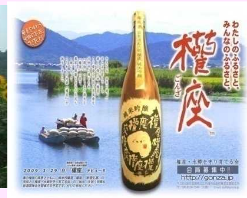
環境こだわり酒米の栽培