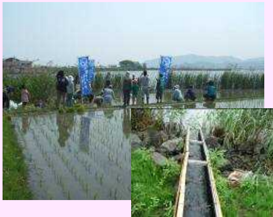
NPOと連携し水田魚道を設置