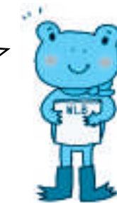
イラスト タカノキョウコ

仕事と生活の調和（ワーク・ライフ・バランス）とは、老若男女だれもが、仕事、家庭生活、地域生活、個人の自己啓発など様々な活動について、自ら希望するバランスで展開できる状態のことです。